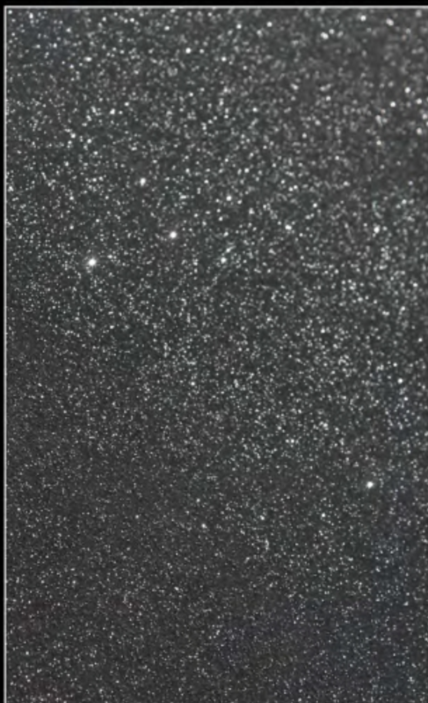
EFFECT 14 • POLVERE DI STELLE SUPER BRILLIANT + SCUDO EPOXY MIRROR