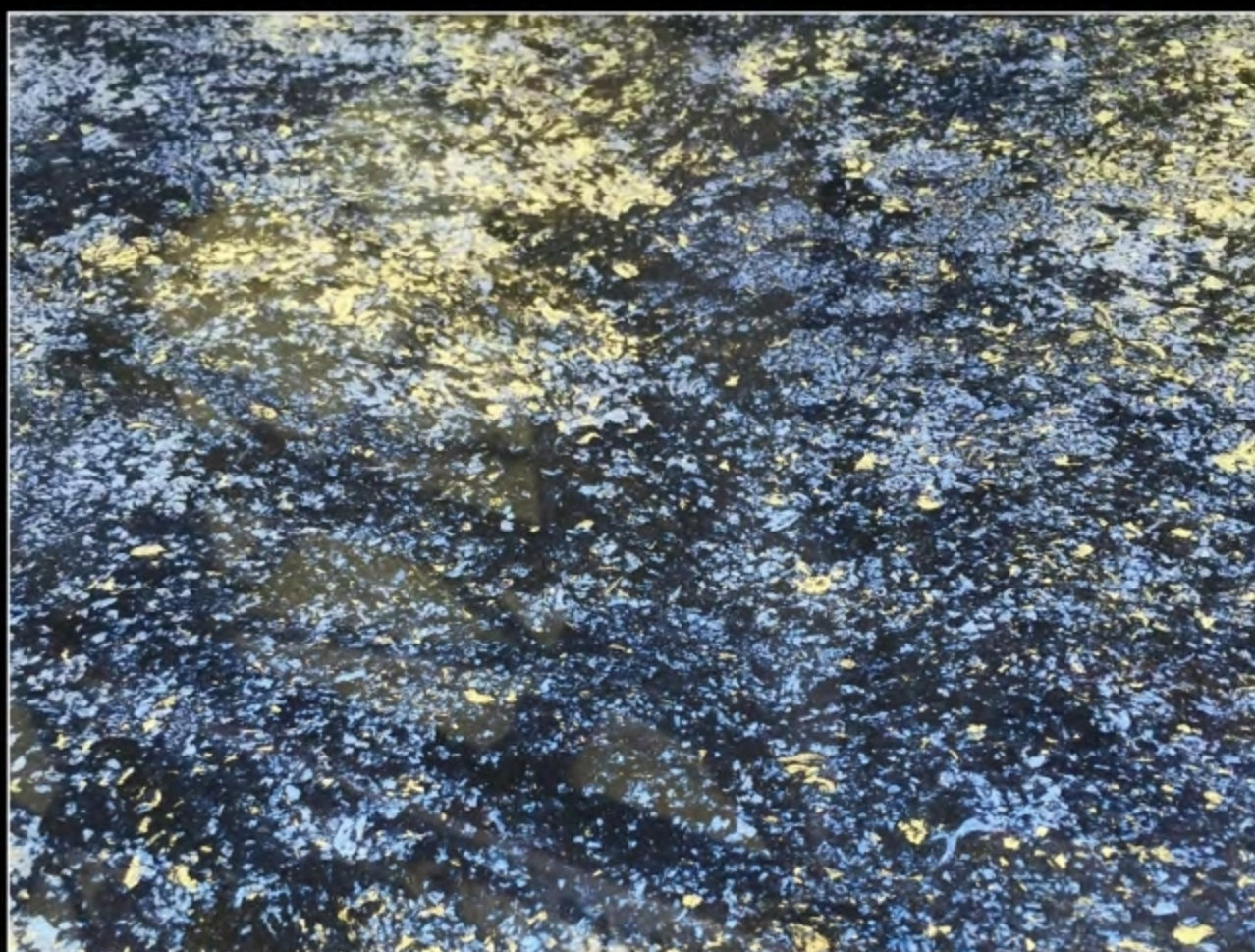
EFFECT 16 • DECOR FONDO NERO + TD COLORI PREZIOSI SKY PEARL + TD COLORI PREZIOSI ORO ZECCHINO + SCUDO EPOXY MIRROR