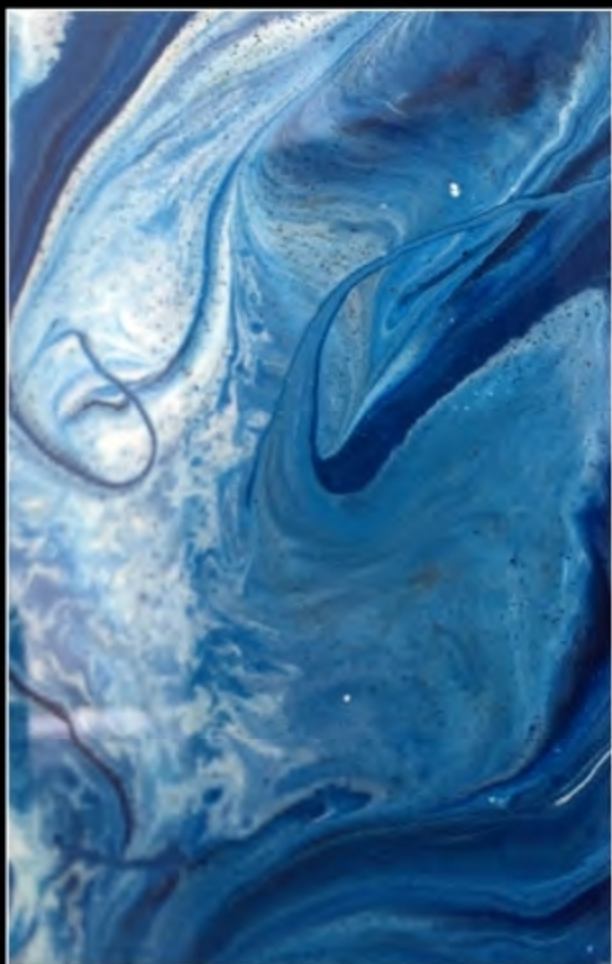
EFFECT 12 • SCUDO EPOXY MIRROR + TN SPECIAL 022 + TN SPECIAL BIANCO