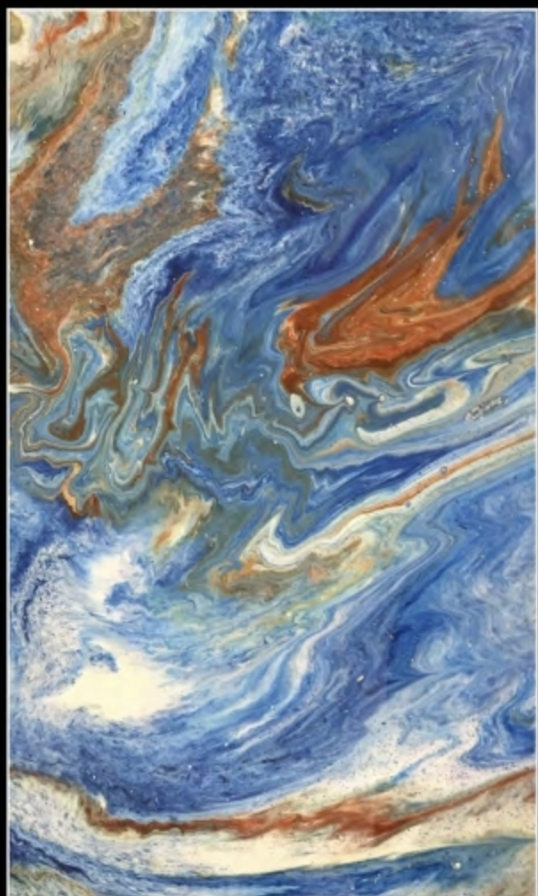
EFFECT 09 • SCUDO EPOXY MIRROR + TN SPECIAL 022 + TN SPECIAL BIANCO + TN SPECIAL 050