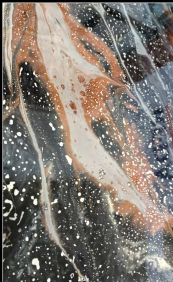
EFFECT 13 • SCUDO EPOXY MIRROR + TN SPECIAL NERO N + TN SPECIAL BIANCO + STRUTURA HI-TECH METALLICO BRONZO