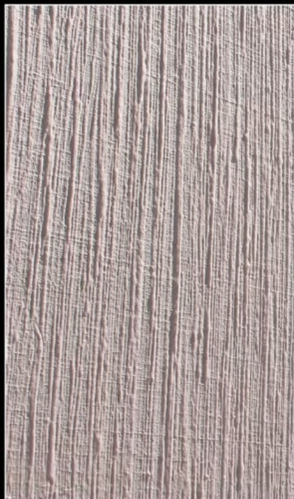
EFFECT 15 • FILO D'ORIENTE SILVER + SCUDO EPOXY MIRROR