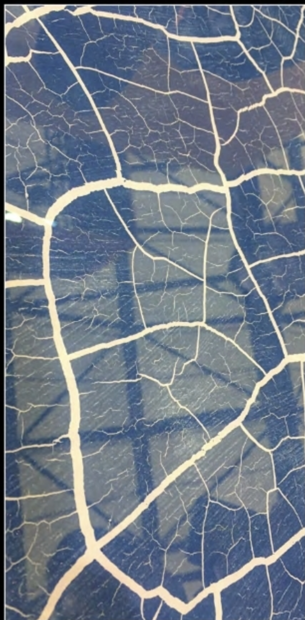
EFFECT 17 • SP CRAQUELÉE + SCUDO EPOXY MIRROR