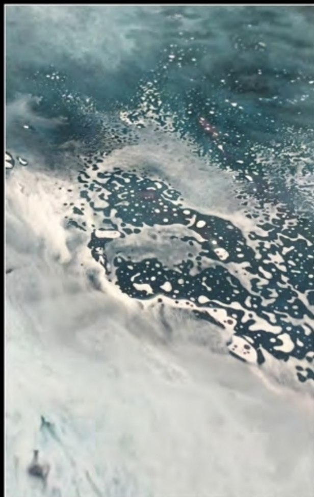
EFFECT 03 • SCUDO EPOXY MIRROR + TN SPECIAL 040 + TN SPECIAL BIANCO