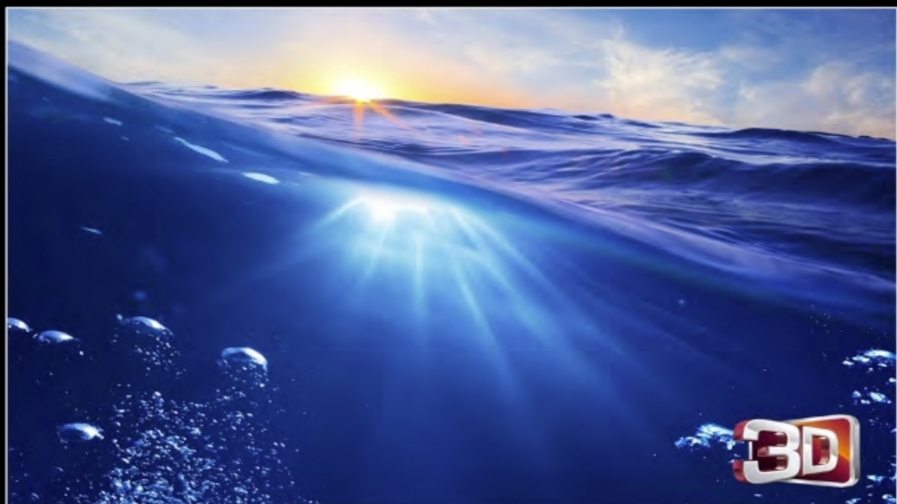
EFFECT 01 - SCUDO EPOXY MIRROR + TN SPECIAL 041 + TN SPECIAL BIANCO

The colors have been received using TN SPECIAL tints in a ratio of 1-2% in weight to the SCUDO Epoxy Mirror. Only for the TN SPECIAL Bianco (White) the ratio is 4%. STRUTTURATI Hi-TECH METALLICO uses instead a 22-25% ratio.