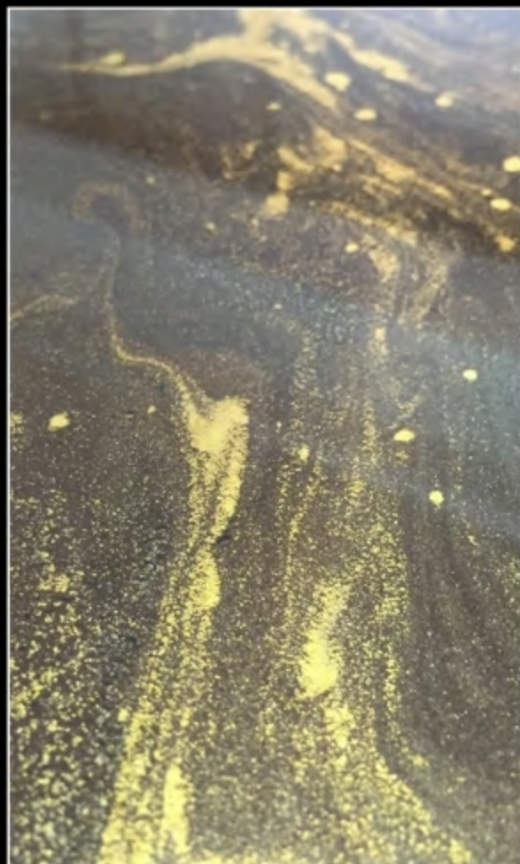
EFFECT 04 • SCUDO EPOXY MIRROR + TN SPECIAL 042 + STRUCTURA HI-TECH METALLICO ORO