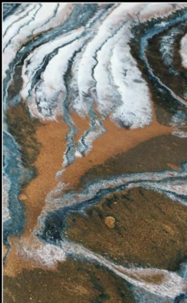
EFFECT 08 • SCUDO EPOXY MIRROR + TN SPECIAL 041 + TN SPECIAL NERO N + STRUTCTURA HI-TECH METALLICO RAME