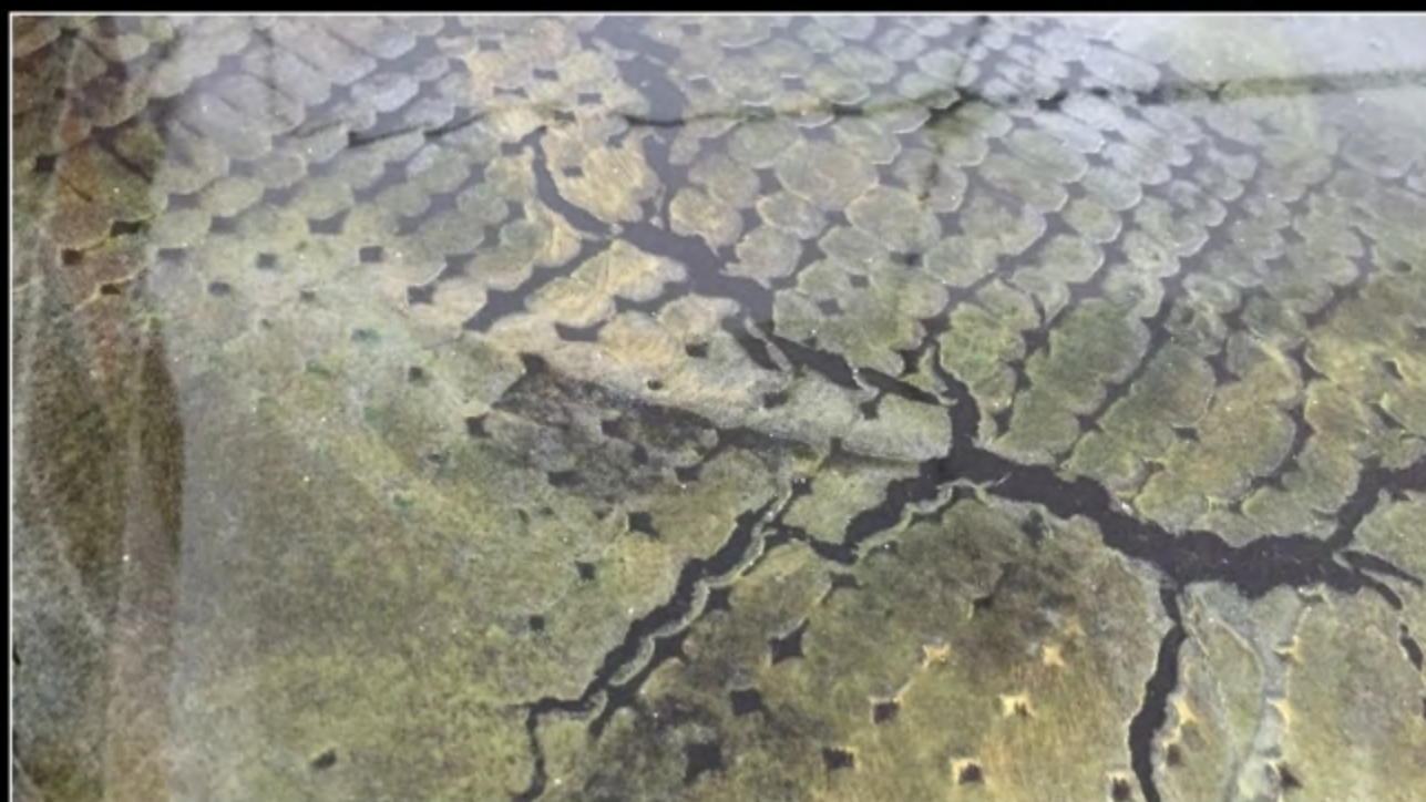
EFFECT 19 • TERRA NOSTRA SPACCANTE HI-TECH + SCUDO EPOXY MIRROR