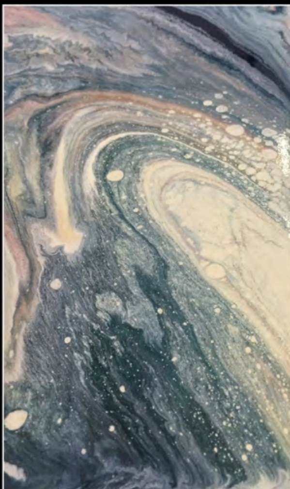
EFFECT 10 • SCUDO EPOXY MIRROR + TN SPECIAL 050 + TN SPECIAL 041 + TN SPECIAL BIANCO

Le colorazioni sono state ottenute utilizzando un disegno di coloranti TN SPECIAL del 1% - 2% in proporzione allo SCUDO Epoxy Mirror. Solo per il TN SPECIAL Bianco una percentuale di colorante del 4%. Per i STRUTCTURA HI-TECH Metallico invece è stato utilizzato una percentuale dal 22 -25%.