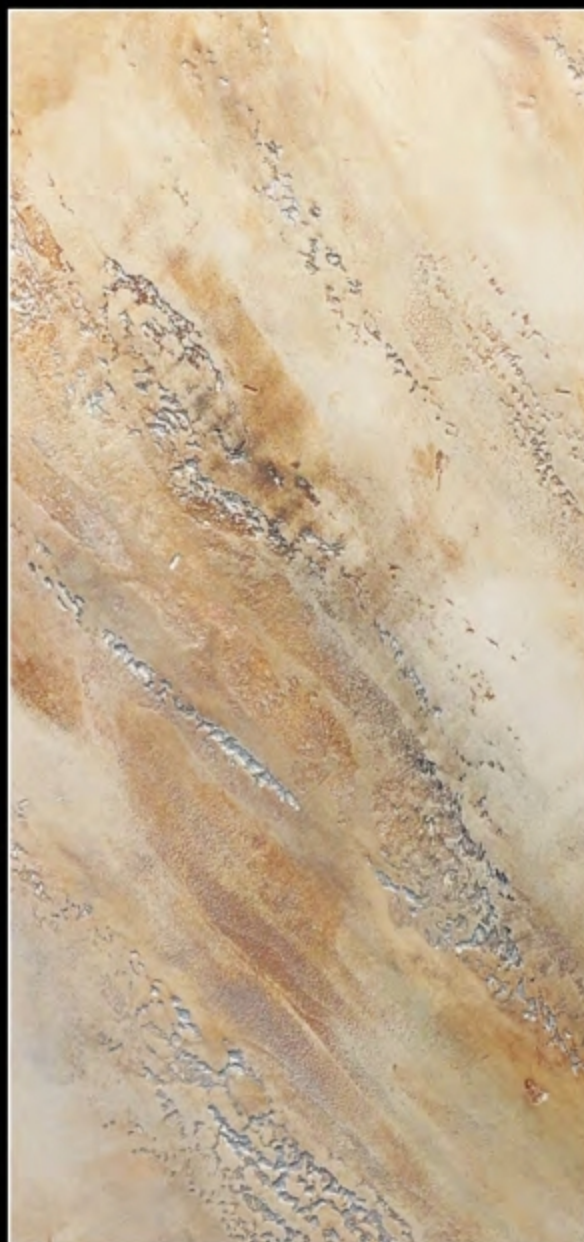
EFFECT 18 • TRAVERTINO LUNA EFFECT + SCUDO EPOXY MIRROR