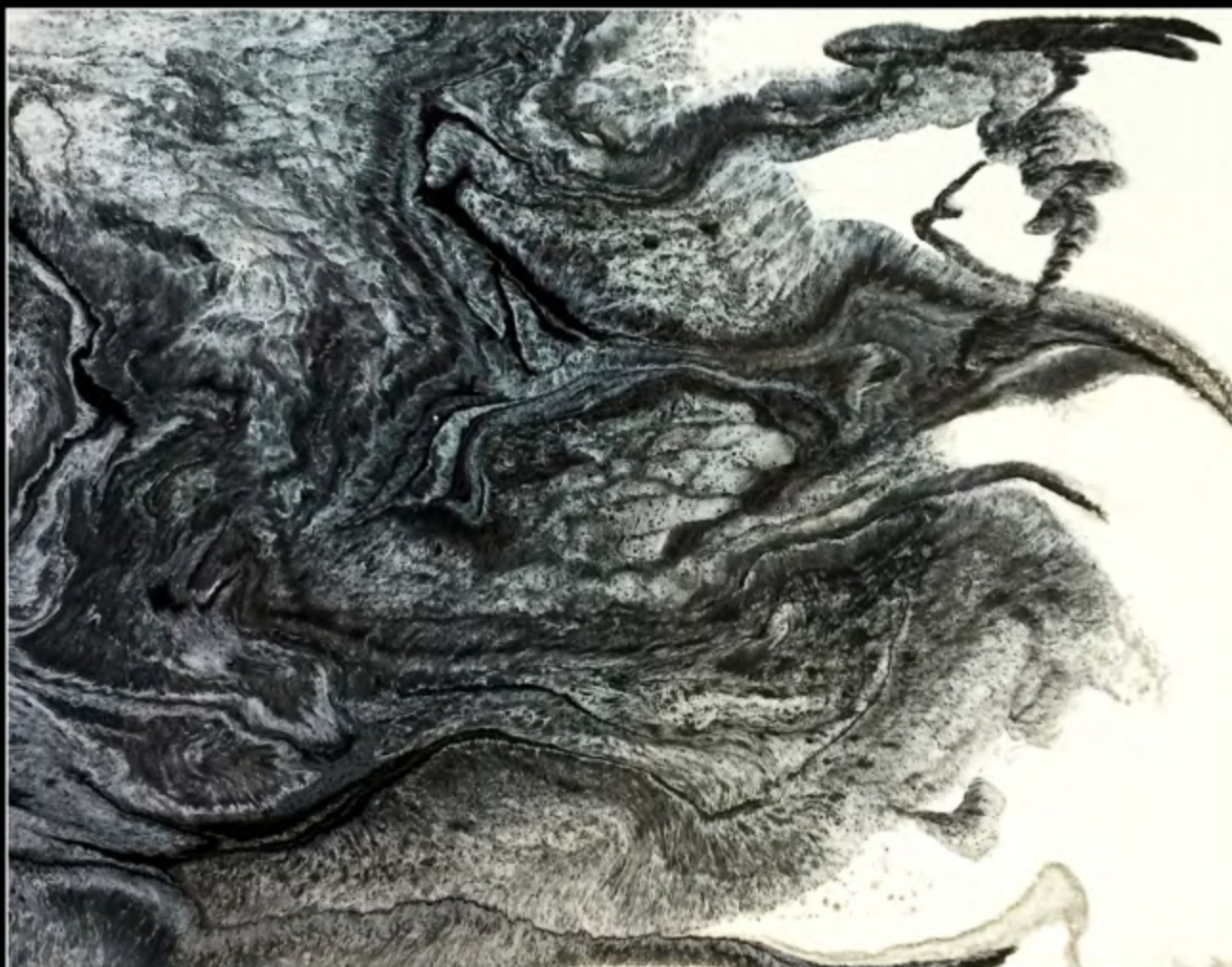
EFFECT 11 • SCUDO EPOXY MIRROR + TN SPECIAL NERO N + TN SPECIAL BIANCO