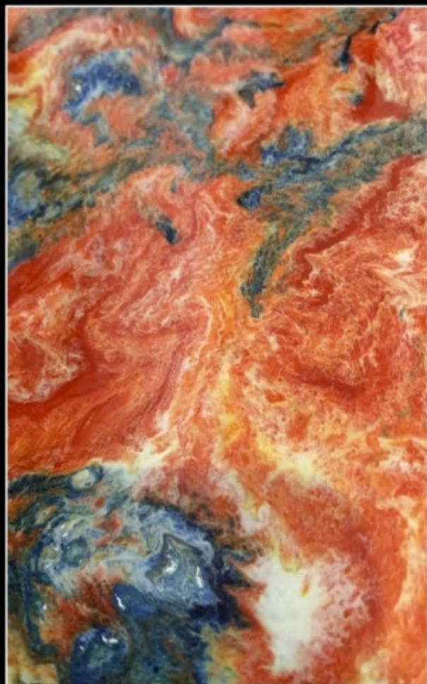
EFFECT 07 • SCUDO EPOXY MIRROR + TN SPECIAL 050 + TN SPECIAL 022 + TN SPECIAL BIANCO