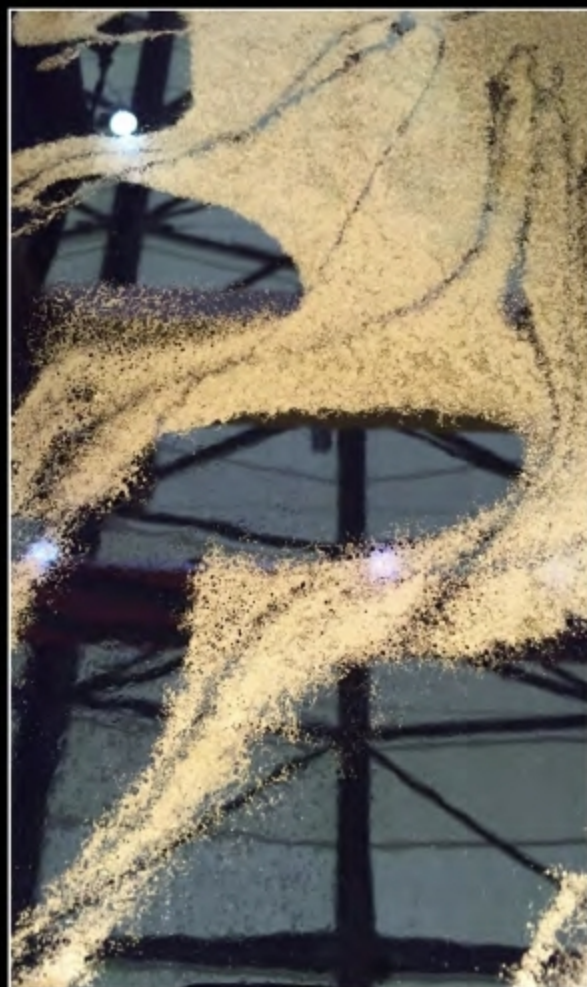
EFFECT 06 • SCUDO EPOXY MIRROR + TN SPECIAL NERO N + STRUCTURA HI-TECH METALLICO BRONZO