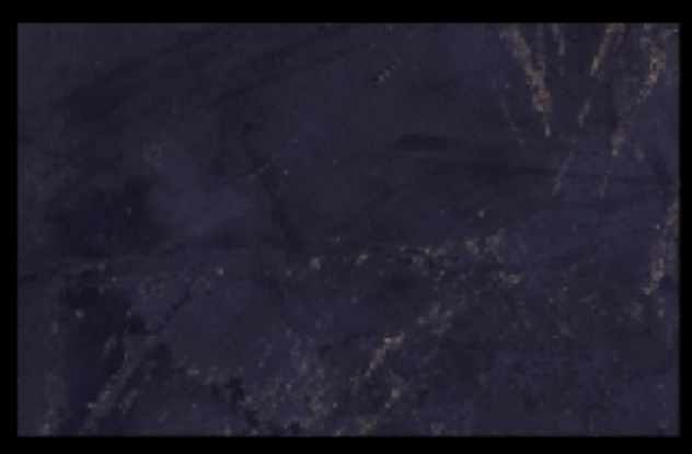
TN 118 Forte additivo Futura Oro