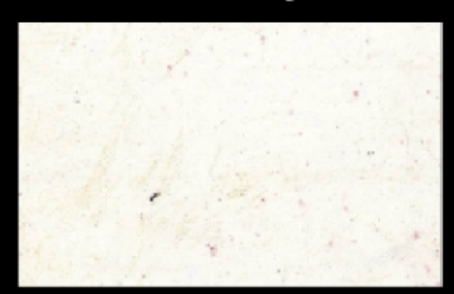
Stucco Bianco con additivo Futura Oro

FUTURA é il nuovo rivoluzionario stucco lucido che permette di lottenere un risultato nuovo e spettacolare con fantactiche striature in oro, argento. Ideele ser ambienti interni sia diassici