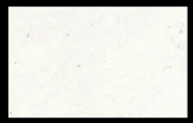
Stucco Bianco con additivo Futura Argento