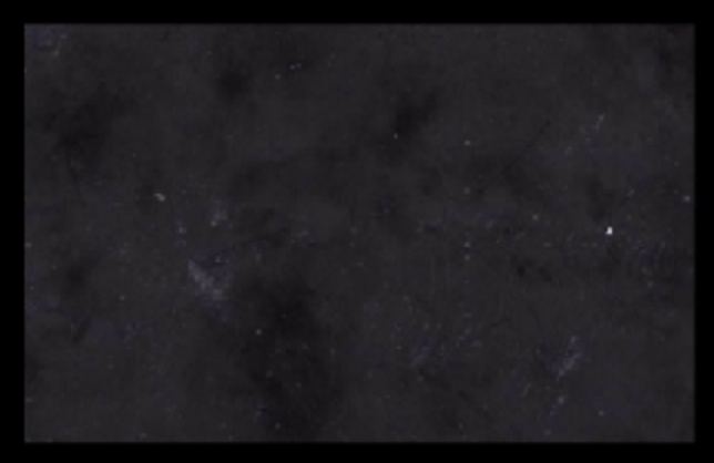
TN 019 Forte con additivo Futura Argento